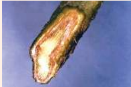
चित्र २५ : फ्यूजारियम विल्ट र यसको कारण भास्कूलर ब्राउनिस