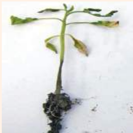
चित्र २१ : गोलभेंडाको बेर्ना कुहिने रोगको लक्षणहरु