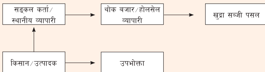
चित्र १० : गोलभेंडाको बजारीकरणमा संलग्न मध्यस्थकर्ताको शृंखला

नेपालमा गोलभेंडा उत्पादक (कृषक) बाट उपभोक्तासम्म विभिन्न मध्यस्थकर्ता हुँदै पुग्दछ । कतै कतै धेरै नगण्य मात्रामा कृषकको बारीबाट उपभोक्तासम्म पुगे तापनि मूलतः सङ्कलनकर्ता, होलसेल बजार हुँदै खुद्रा व्यापारी मार्फत उपभोक्ताको चुलोसम्म पुग्दछ (चित्र नं. १०) ।