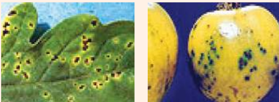
चित्र ३१ : पात र फलमा ब्याक्टेरियाबाट हुने थोप्ले रोगका लक्षण