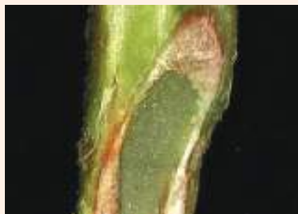
चित्र २६ : भर्टिसिलियम विल्टको लक्षण र काटिएको डाँठमा ब्राउनिङ्ग