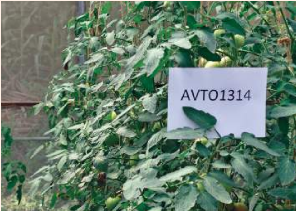
प्लाष्टिक घरभित्र गोलभेडाको अग्लो बोट हुने जात AVTO 1314