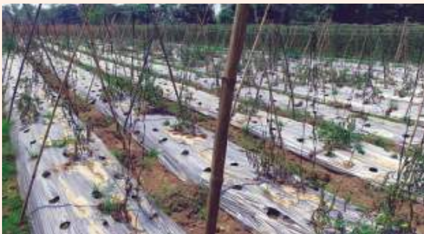
चित्र ४ : गर्मीयाममा प्लाष्टिक मल्लु गरिएको गोलभेंडा फिलडमा ओइलाएको