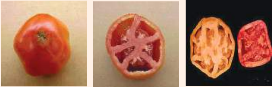
चित्र ३९ : फल खोक्रो हुने समस्याको लक्षण