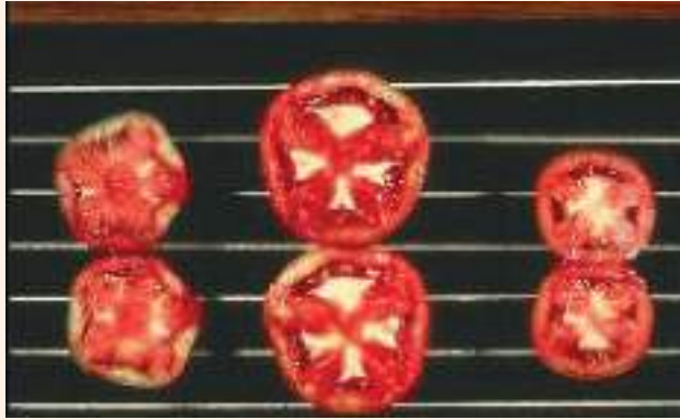
चित्र ३८ : भिन्न सेतो हुने समस्याको लक्षण