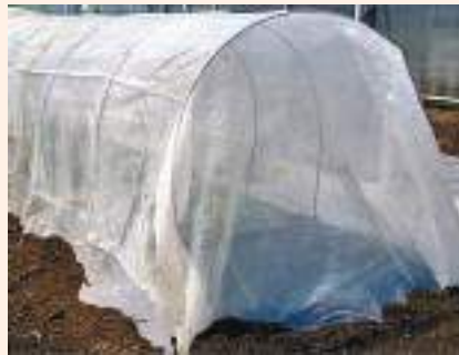
चित्र ३ : कीराबाट बचाउन स्थानीय स्तरमा बाँस वा फलामको प्रयोग गरी बनाइएको टनेललाई माथिबाट ४० मेसको नाइलन जालीको प्रयोग गरेको (स्रोत: ए.भि.आर. डि.सी.) ।