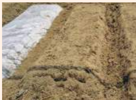
चित्र १ : सौर्यतापबाट माटोको उपचार