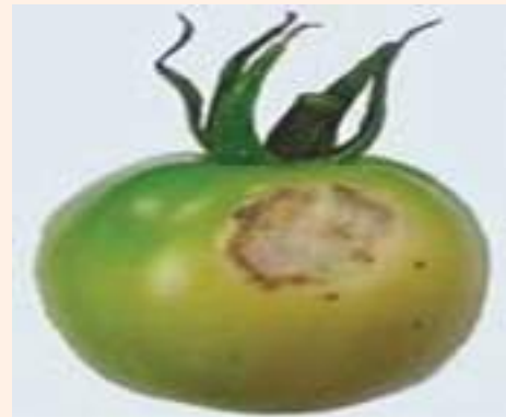
चित्र ३६ : सन स्काल्ड र टाटा-पाटा गरी फल पाक्ने समस्याको लक्षण