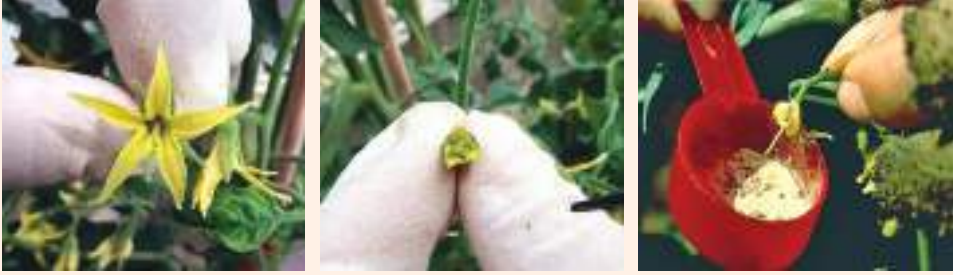
चित्र १२ : फूलको पोथी भागको टुप्पा परागकणमा छुवाई परागसँचन गरिएको