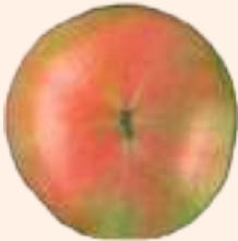
गुलाबी वैजनी (३०-६०% रङ्ग चढेको)