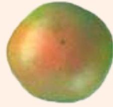
टर्निङ्ग (१०-३०% रङ्ग चढेको)