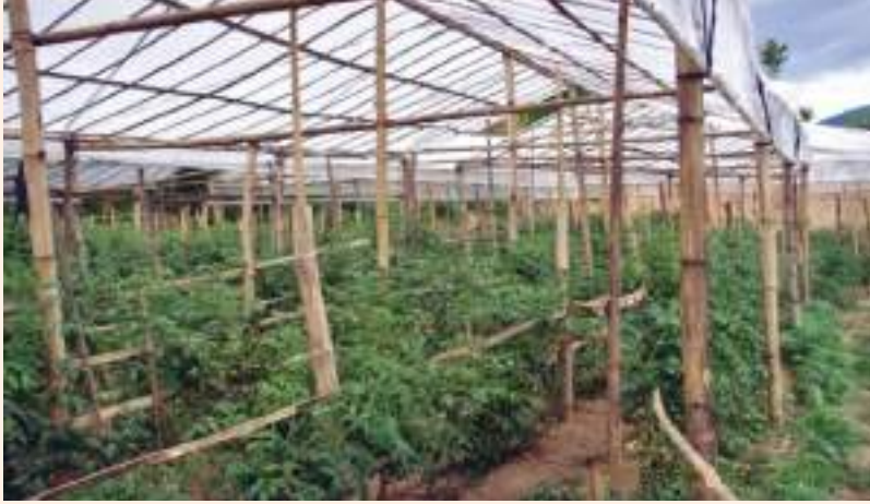
चित्र १३ : गोलभेंडाको बोटलाई थाँक्रा तथा भाटा दिइएको

फलको गह्रौपनाले बोट भुइँमा नलतारिने, एकनासले घाम पाउने, काँटछाँट, परागसंचन क्रिया र रोग कीरा नियन्त्रणको लागि विषादी छर्न सजिलो पर्ने हुनाले गुणस्तरीय फल तथा बीउको उत्पादन गर्न सकिन्छ ।