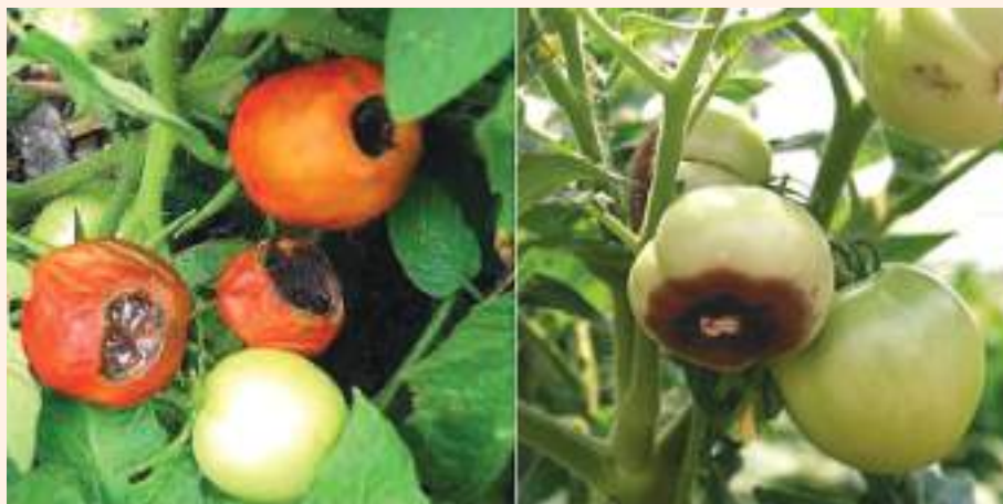
चित्र ३४ : फलको टुप्पा कुहिने रोगको लक्षण