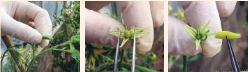
चित्र ११ : भाले अङ्ग हटाउने तरिका र भाले अङ्ग हटाएको फूल