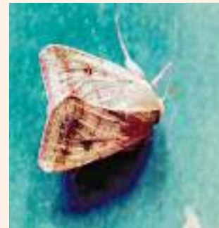
चित्र १७ : गोलभेंडाको फलमा लाग्ने गवारो र त्यसले पुऱ्याएको क्षति