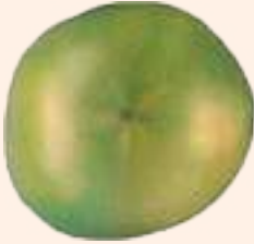
हरियो (पूर्ण विकसित)

गोलभेंडाको टिप्ने समय साधारणतया फलको रङ्गको आधारमा निर्धारण गरिन्छ । लामो दूरीको बजारमा ढुवानी गर्नुपर्ने गोलभेंडाहरूलाई भरसक रङ्ग परिवर्तन हुन लागेको अवस्थामा उत्पादन लिनुपर्दछ । स्थानीय बजारको लागि हल्का रातो रङ्ग चढेको अवस्थामा टिप्नुपर्दछ । घरायसी प्रयोग, बीउ उत्पादन र प्रशोधनको लागि फल टिप्दा पूरा पाकेको अवस्थामा टिप्नुपर्दछ (चित्र ८) ।