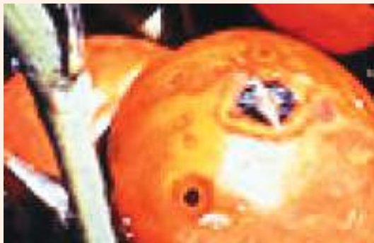
चित्र २८ : एन्थ्राकनोज रोगको लक्षण (स्रोत: बाली रोग बिज्ञान महाशाखा, नार्क)