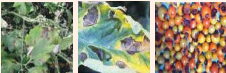
चित्र २३ : गोलभेंडाको पात र फलमा लाग्ने अगौटे डढुवाको लक्षण