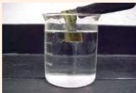
चित्र ३० : ब्याक्टेरियल ओइलाउने रोगको लक्षण र पहिचाहन विधि