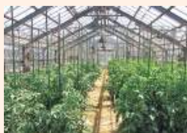
चित्र ६ : खुला जग्गामा र प्लाष्टिक घरमा गोलभेंडा खेती गर्दा अपनाइएको टेका दिने प्रणाली