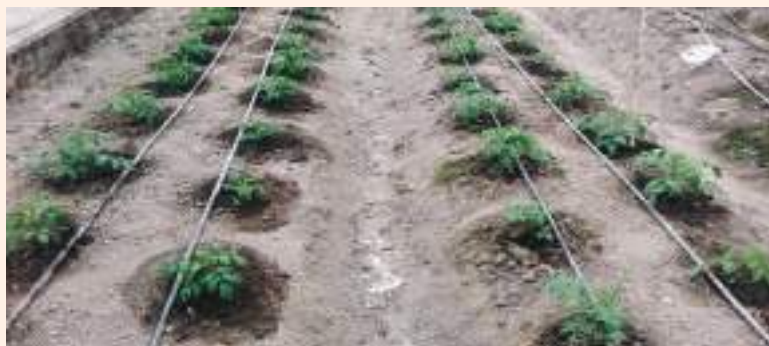
चित्र ५ : गोलभेंडामा थोपा सिंचाइको प्रयोग

पानीका अभाव भएमा गोलभेंडाका विरूवाहरूको वृद्धि कम हुनुका साथै फल उत्पादन पनि कम हुन्छ । अत्याधिक मात्रामा पानीको अभाव भएमा विरूवा ओइलाउने र फूल भर्ने समस्या बढी हुन्छ । विरूवा प्रसारण गरेपछि र मलखाद प्रयोग गरेपछि सिंचाइ दिन आवश्यक पर्दछ । फूल फुल्ने र फलको वृद्धि हुने बेलामा पानीको अभाव हुन दिनु हुँदैन । प्लाष्टिक घरभित्र थोपा सिंचाइ पद्धति धेरै प्रभावकारी पाइएको छ (चित्र ५) । थोपा सिंचाइको माध्यमबाट मलखाद र विरूवाबर्द्धक रसायन दिँदा धेरै राम्रो हुन्छ ।