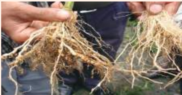
चित्र २९ : जरामा गाठा पर्ने रोगबाट ग्रस्त गोलभेंडाको असमान्य जरा