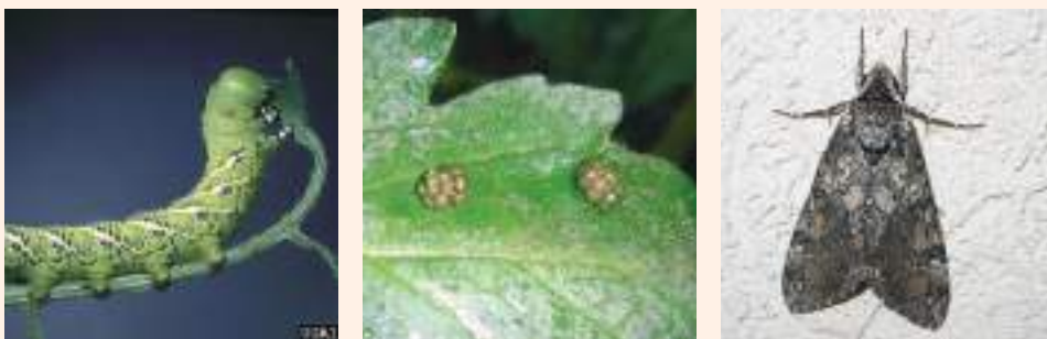
चित्र १९ : सूर्तीको पातखाने लाभ्रे कीराको फुल, लाभ्रे र माउ

सूर्तीको पातखाने लाभ्रे कीराले गोलभेंडाको पात, डाँठ र फलमा आक्रमण गर्दछन् । पुतलीले पातको तल्लो भागमा एकै ठाउँमा खैरो भुवाले ढाकिएको अवस्थामा अण्डा पार्छ । अण्डा ४-५ दिनमा लाभ्रेमा परिणत भई एकै ठाउँमा बसी पातको नसा बाहेक अरू खान सुरू गर्छ ।