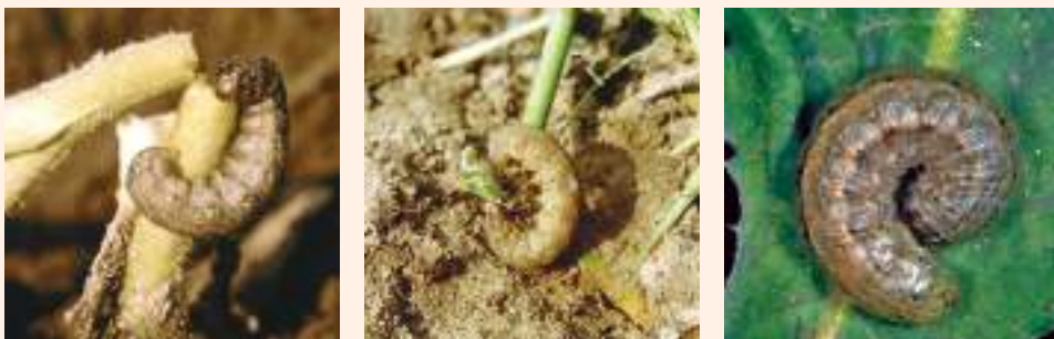
चित्र २० : खुभ्रे कीरा र त्यसले बालीमा पुऱ्याएको नोक्सान