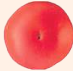
रङ्ग बढ्दै गएको रातो (९०% भन्दा माथि)

चित्र ८ : फल टिप्नको लागि विभिन्न अवस्थाको गोलभेंडा