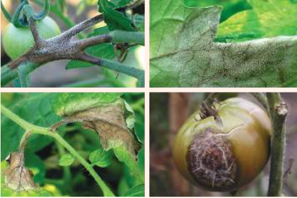
चित्र २२ : गोलभेंडाको पात, डाँठ र फलमा लाग्ने पछ्रोटे डढुवाको लक्षण