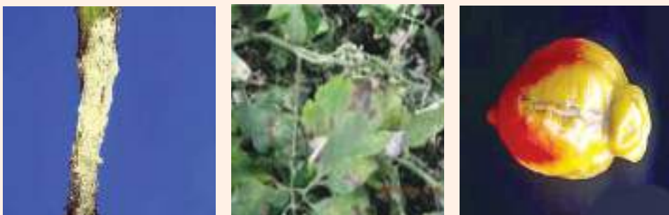
चित्र २४ : फोमोप्सीस ब्लाइटको डाँठ, फल र पातमा देखिने लक्षण