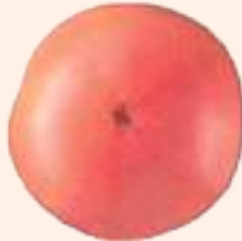
रङ्ग चढ्न सुरु हल्का रातो (६०-९० % रङ्ग चढेको)