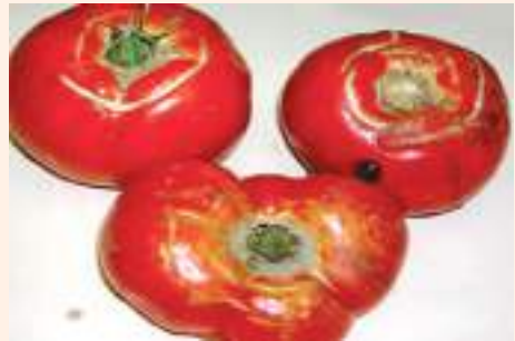
चित्र ३५ : फल फुट्ने समस्याको लक्षण