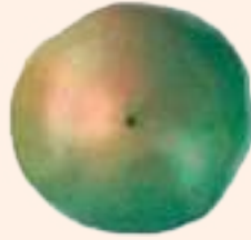
ब्रेकर (१०% भन्दा कम रङ्ग चढेको)