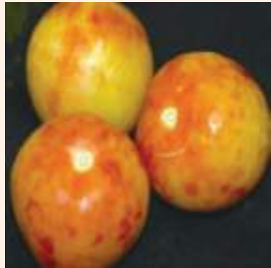
चित्र ३३ : गोलभेंडामा लागने विभिन्न भाइरस रोगका लक्षणहरू (क्रमशः Tomato Chlorosis Virus, Tomato Yellow Leaf Curl Virus, Tomato Necrotic Spot Virus, Shoestring leaf blade induce by CMV Tomato, Marchitez Virus, Pepino Mosaic Virus)