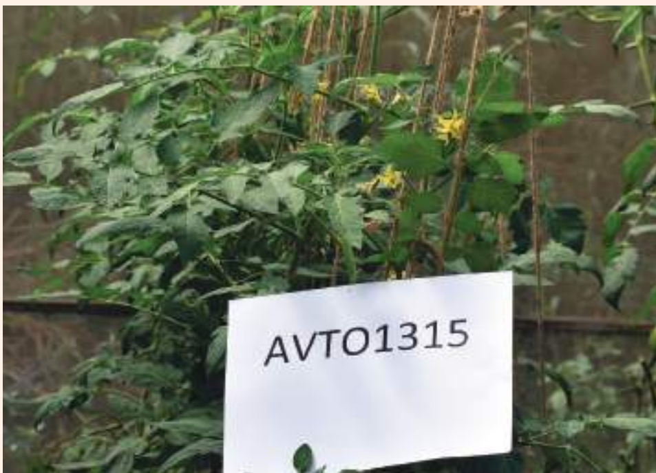
प्लाष्टिक घरभित्र गोलभेडाको अग्लो बोट हुने जात AVTO 1315