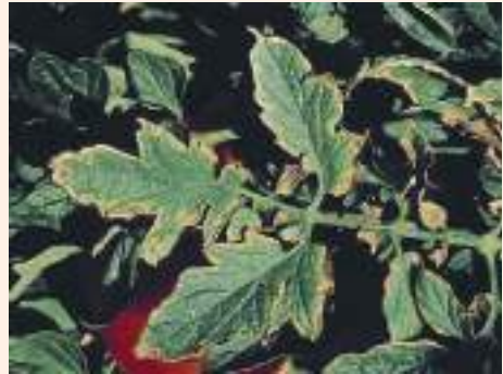
चित्र ३२ : पात र फलमा ब्याक्टेरियाबाट हुने रोगको लक्षण