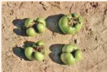
चित्र ३७ : चिसोले फलमा देखिने बिरालोमुखे विकृतिको लक्षण