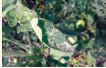
चित्र १६ : गोलभेंडाको पातमा लिफ माइनरको क्षतिका लक्षणहरु