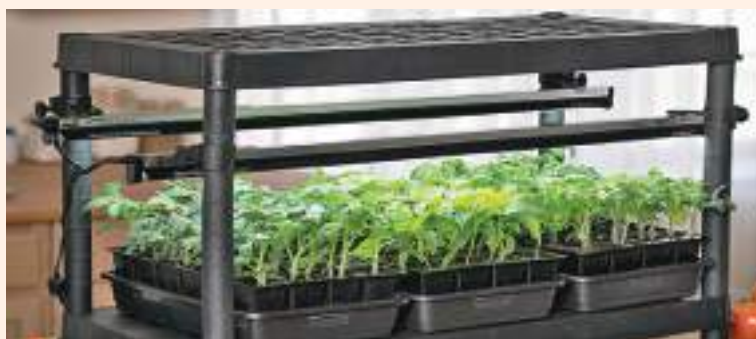
चित्र २ : बीउ उमानेको लागि प्रयोग भएका प्लाष्टिक ट्रे

हिजो आज प्लाष्टिक ट्रेमा बेर्ना उत्पादन गरी लगाउने चलन प्रख्यात हुँदै आएको छ। यस तरिकामा प्लाष्टिक ट्रेमा भएका खोपिल्टालाई पहिले कोको पिट वा भर्मिकुलाइट वा पर्लाइट जस्ता मिडियाले भरनु पर्दछ र त्यसैमा १-१ दाना बीउ रोपी बेर्ना उत्पादन गर्नुपर्दछ (चित्र २)। यसमा उत्पादन गरिएका विरूवा सार्दा जराको डल्ला नफुट्ने र सजिलै सर्ने हुन्छ। मिडिया बनाउँदा १:१:१:१ भाग माटो, बालुवा, कम्पोष्ट र धानको भुस वा २:१:१ भाग नरिवलको धुलो मल, माटो र कम्पोष्ट मिसाई तयार गर्नुपर्दछ। उक्त मिडियालाई चिसो गरि ३-४ हप्तासम्म सेतो प्लाष्टिकले ढाक्नु पर्दछ। सम्भव भएमा १२०° से. तापक्रममा ४५ मिनेटसम्म उपचार गर्नु पर्दछ।